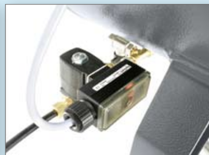
► Purgeur temporisé

Des kits d'entretien Atlas Copco existent sur ces compresseurs alternatifs. Les intervalles de maintenance doivent être respectés afin d'optimiser la production et la durée de vie du compresseur.