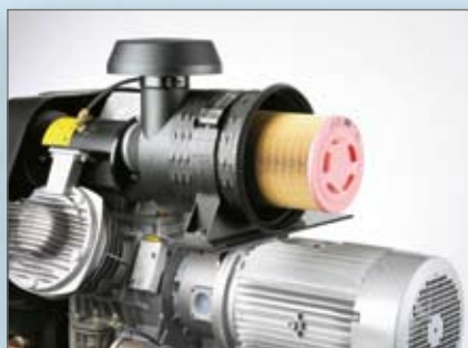
► Pré-filtre sahara