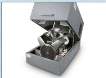
► Capot d'insonorisation